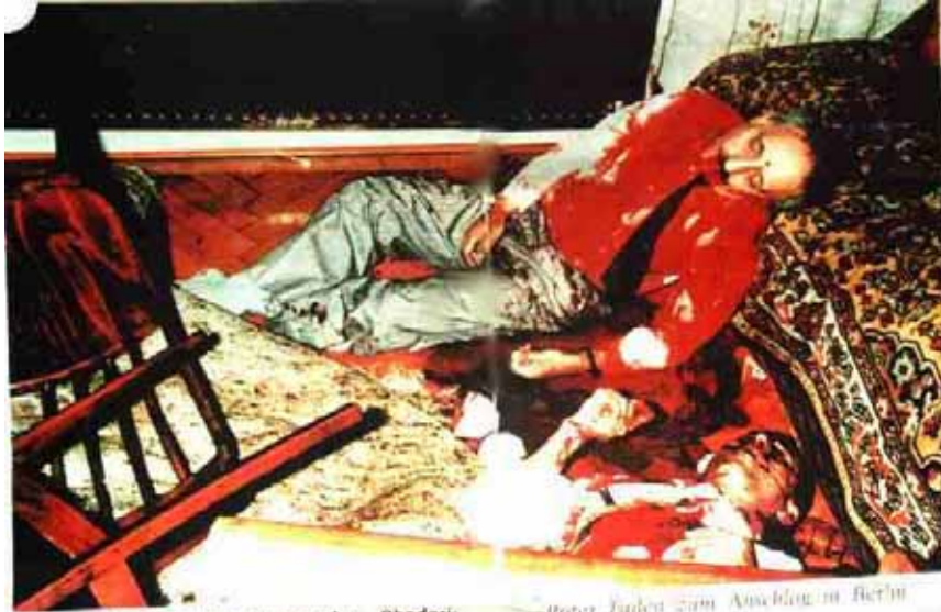
Dr. Qasimlo (13.07.1989)