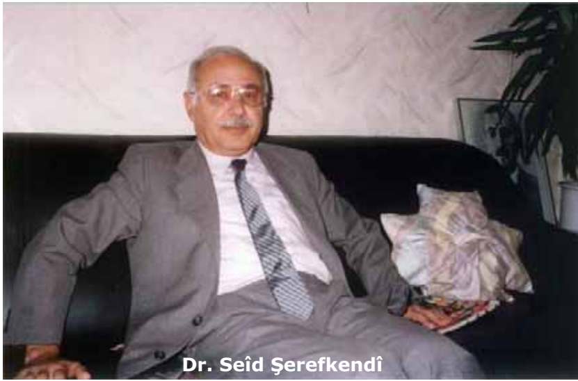
Dr. Seîd Şerefkendî