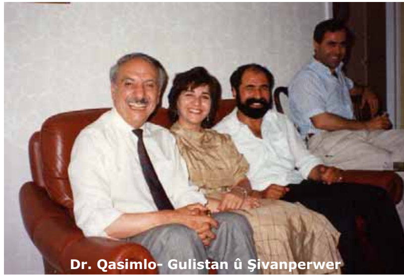
Dr. Qasimlo- Gulistan û Şivanperwer